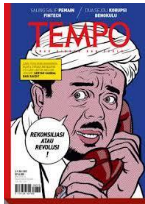
Gambar 2. Habib Rizieq edisi 3-9 Juli 2017

Tahap signifikansi karikatur di atas dapat dilihat pada tahapan berikut: