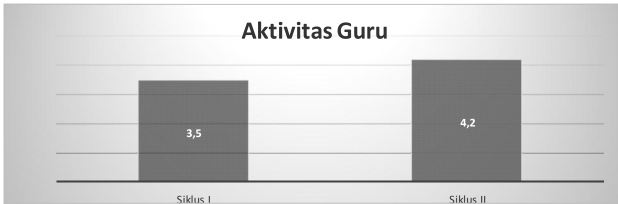
Gambar 2. Grafik Aktivitas Guru dalam Mengelola Pembelajaran

Pada grafik di atas, siklus I aktivitas guru dalam mengelola pembelajaran dengan menggunakan model pembelajaran Numbered Head Together (NHT) sudah tergolong baik yaitu dengan rata-rata 3,5. Pada siklus ke II terlihat aktivitas guru dalam mengelola pembelajaran sudah ada peningkatan menjadi baik yaitu 4,2. Berdasarkan kriteria yang telah ditetapkan yaitu setiap aspek yang diamati secara rata-rata harus bernilai baik atau sangat baik, maka aktivitas guru dalam mengelola pembelajaran dengan menggunakan model pembelajaran Numbered Head Together (NHT) adalah baik.