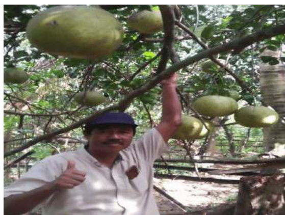
Gambar 1. Budidaya Jeruk Pamelos Warga di Lereng Gunung Muria

Berdasarkan hasil diskusi dan observasi, diperoleh bahwa warga sekitar MTs NU Umar Sa'id membudidayakan buah jeruk pamelos (Gambar 1) untuk hasilnya dijual bagi para peziarah, tetapi tidak mengetahui cara memanfaatkan limbah kulitnya. Hal ini menjadi potensi lokal yang dapat dikembangkan di lingkungan madrasah sebagai bahan ajar. Beberapa penelitian yang mengembangkan potensi lokal sebagai bahan ajar diantaranya: Ismiati (2020), Jumriani & K. Prasetyo (2017), Situmorang (2019), dan Widowati et al. (2013).