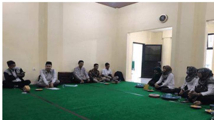
Gambar 6. Foto FGD evaluasi keterlaksanaan pengabdian kepada masyarakat

Berdasarkan hasil FGD evaluasi kegiatan pengabdian, kepala madrasah menyampaikan bahwa 1) keterampilan siswa dalam menggunakan alat praktikum masih kurang, sehingga perlu adanya pendampingan selanjutnya dan 2) perlu adanya upaya untuk memanfaatkan potensi lokal sebagai bahan riset, agar potensi lokal gunung Muria tetap eksis. Untuk merealisasikan hal ini, perlu adanya kegiatan riset yang rutin diadakan, tetapi tidak mengganggu kegiatan belajar mengajar. Pihak madrasah dan tim pengabdian sepakat untuk memasukkan program ini ke dalam kegiatan ekstrakurikuler wajib. Pelaksana kegiatan program ini adalah guru IPA. Tentu di dalam pelaksanaannya, guru IPA terus berkoordinasi dengan dosen tadaris IPA IAIN Kudus. Jika program ini dapat berjalan dengan baik, MTs NU Raden Umar Sa'id menjadi MTs yang berbasis riset STEM yang mampu memanfaatkan potensi lokal gunung Muria. Selain itu, madrasah-madrasah di sekitarnya akan mencontohnya. Dengan demikian, potensi lokal tidak hanya sebagai komoditas ekonomi, melainkan dapat menjadi bahan riset siswa. Foto FGD evaluasi pengabdian kepada masyarakat ditampilkan Gambar 6.