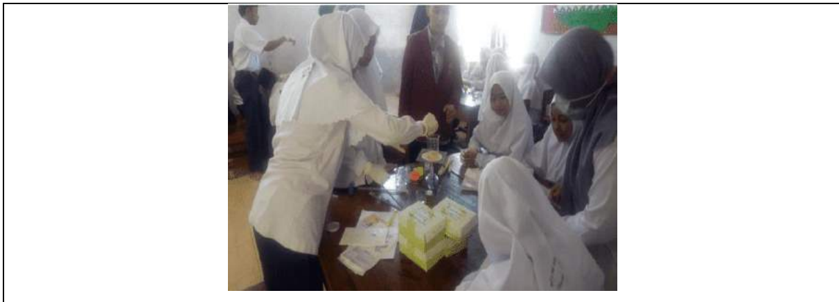
Gambar 3. Foto Kegiatan Pendampingan