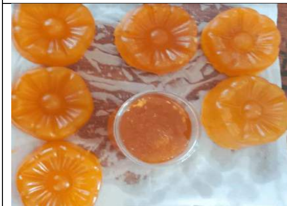
Gambar 4a. Foto Hasil Produk Sabun