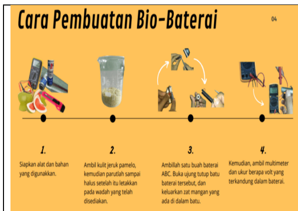
Gambar 2a. Panduan Pembuatan Sabun

Pada saat uji coba, sabun masih menimbulkan rasa gatal Ketika digunakan dan voltase biobaterai masih sangat kecil (0,2-0,6V). Dengan adanya permasalahan ini, tim mencari solusi agar sabun tidak gatal dengan mengurangi takaran salah satu bahan yaitu alkohol. Untuk biobaterai, kulit jeruk dihancurkan menggunakan alat blender lebih lama, agar butiran menjadi sangat kecil. Setelah dibuat, voltase biobaterai menjadi (1,3-1,6V). Setelah diuji coba sabun dan biobaterai, panduan pembuatan disusun (Gambar 2a dan 2b).