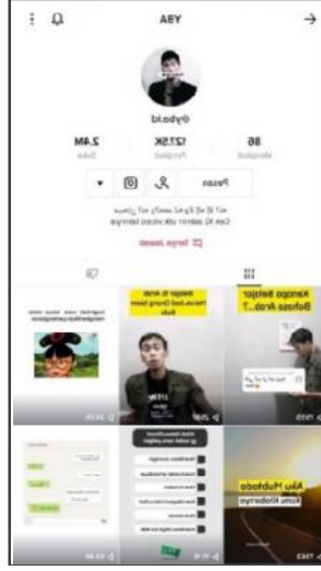
رسم توضيحي yba.id2

في . وفي هذا المحتوى الصانع يشرح ويتكلم كلاما واضحا حتى يكون تسهيل الفهم عند الطلبة.