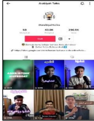
رسم توضيحي @arabiyahTalks3

أى أن هناك كثير من أثر الإيجابي في تيك توك وكثير من الناس أن يجعل هذا إيجابيا بالمحتويات الإيجابيات من تعليم اللغة العربية. ومن هنا يعرف أن تيك توك ليس دائما كالترفيه بالرقاص أو غيرها بل يكون هذا كالوسائل لإلقاء العلوم والمعارف خاصة في اللغة العربية بمهارة الكلام.